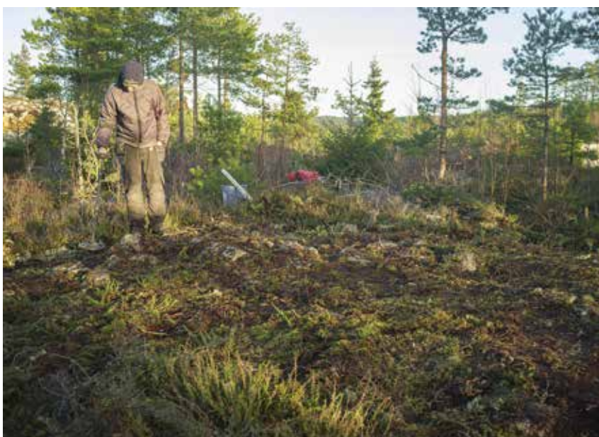
Den övre bilden visar hur stensättningen Herrestad 210 såg ut när vi först kom dit. Den undre bilden visar Herrestad 210 efter det att ljung och ris tagits bort. Enstaka stenar är synliga. Hur stensättningen såg ut när all torv och mossa tagits bort visar bilden på sidan 3.