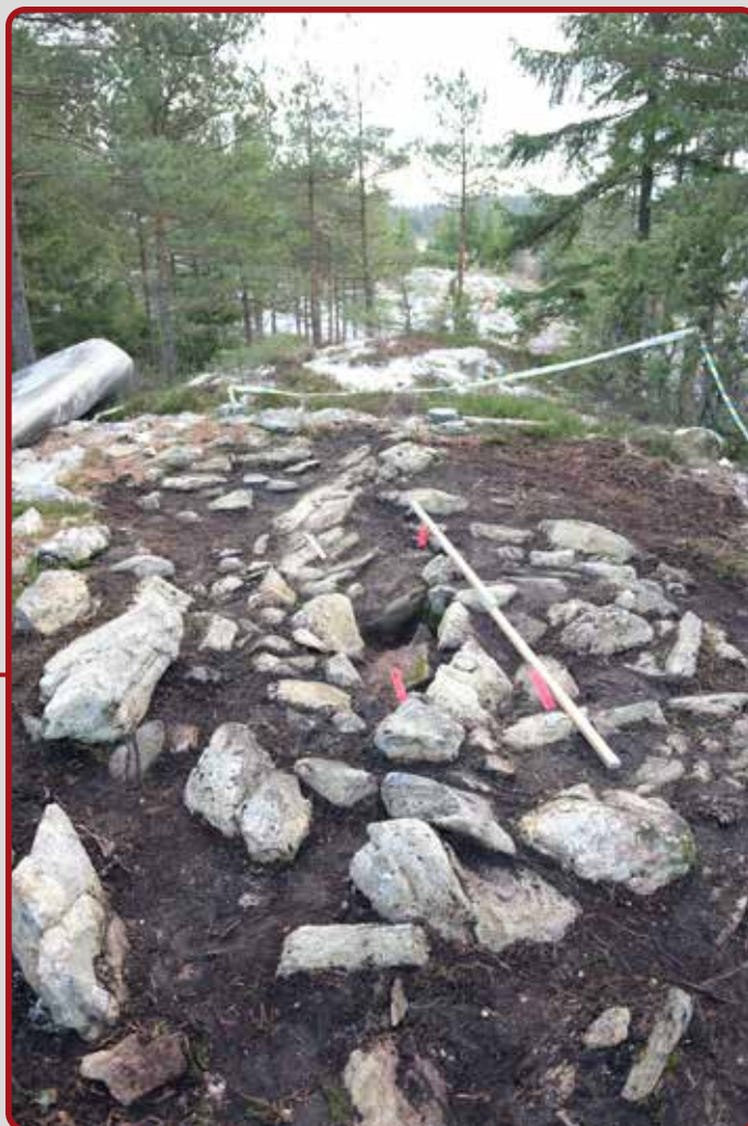
Stensättningen Herrestad 210:1 efter avtorvning och framrensning.

en helt kort tidsrymd, eller i olika steg under en period av som mest ett par hundra år.