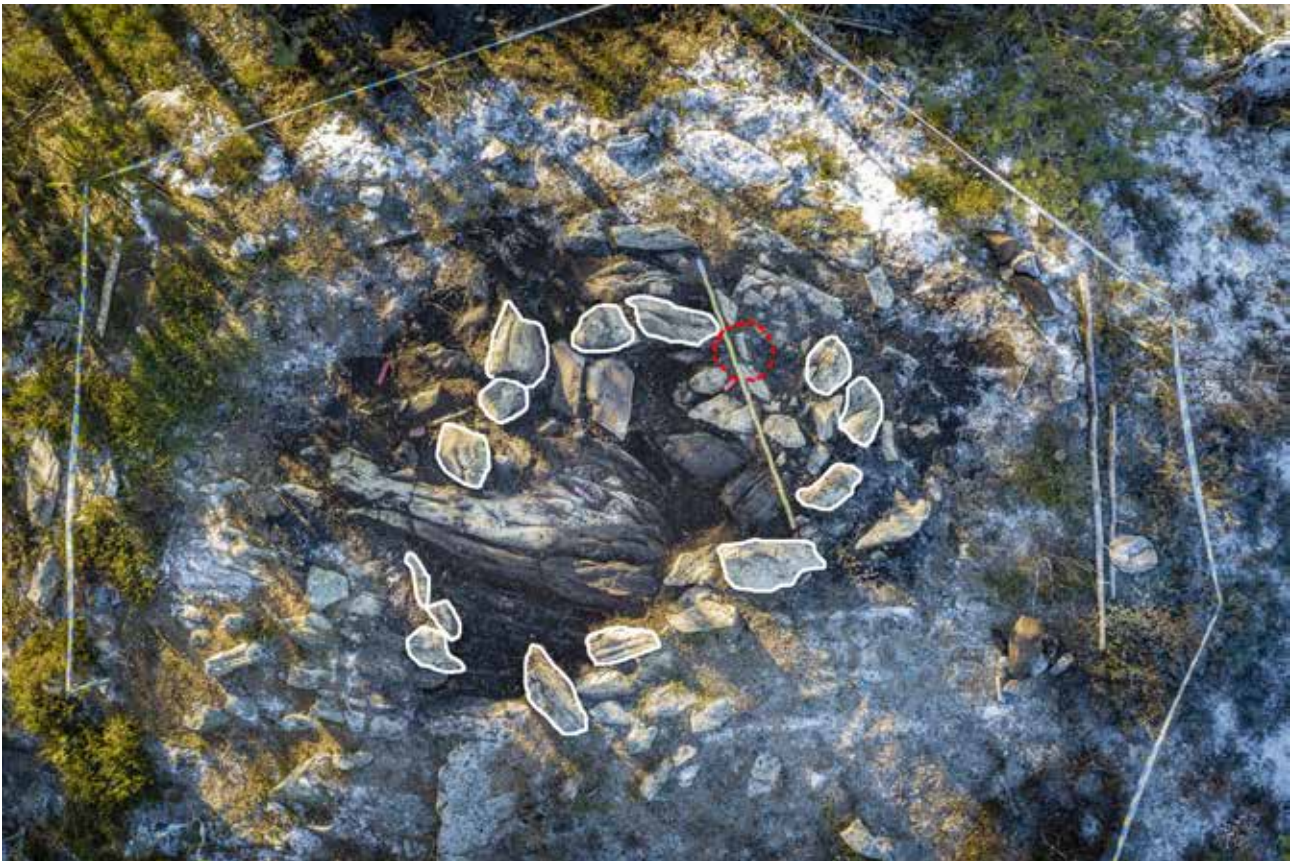
Stensättningen Herrestad 210 vid undersökningen. De flesta stenar har tagits bort men kantstenarna ligger kvar. Dessa är markerade med vitt och platsen för gravgömman med rött.