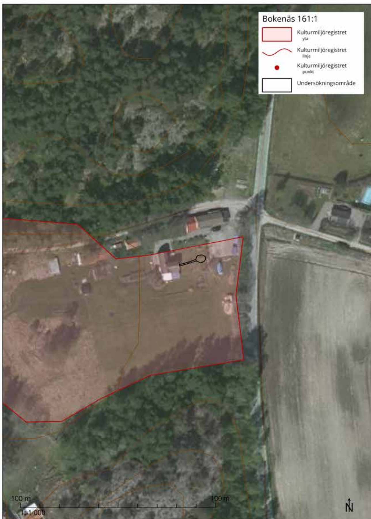
Illustration 2. Undersökningsområdet markerat med svart. Den tidigare antikvariska kontrollen undersökte ytan under den del av ekonomibyggnaden som har rött tak. Bakgrund © Lantmäteriet.