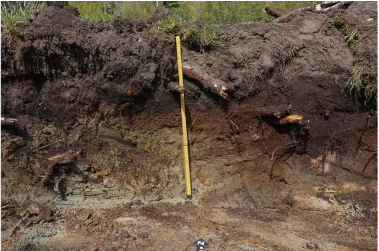
Illustration 3. Lagerprofil från schakt 4, foto mot norr.