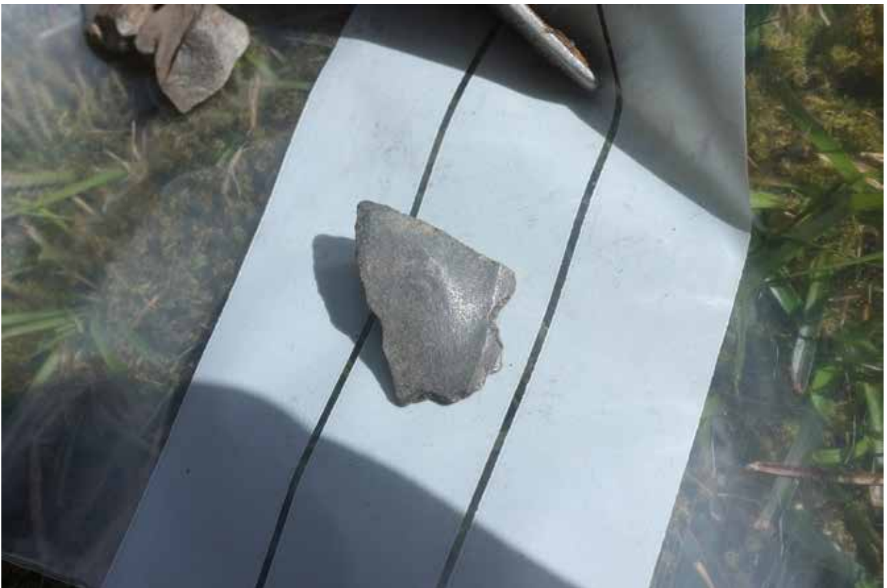
Illustration 4. Avslag med konkav retusch.