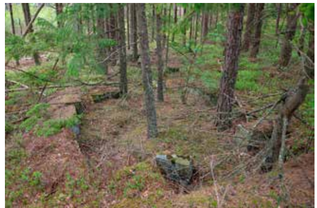
Illustration 5 (överst). Småindustriområdet L2019:2399 söder om verksplats 1. Linda skymtar till vänster när hon mäter in områdesbegränsningen. Lämningen omfattar fem skilda brottytor och ett stort antal ämnen. Sannolikt har man tillverkat smågatsten. Foto mot nordväst. Illustration 6 (underst vänster). Den övre av två brottytor inom småindustriområdet L2019:2393. Foto mot nordväst. Illustration 7 (underst höger). Stenbrottet L2019:2398 består enbart av en brottyta. Foto mot väster.

möjligen utgör resterna av en stensättning. 1 Fornlämningstypen kan sägas vara kännetecknande för området med ett flertal gravar i gränzonen mellan Skee och Lurs socknar. Stensättningarna är placerade precis öster om toppen på berget och bedöms som orienterade åt nordost. Det är viktigt att projektets visuella påverkan på gravmiljön begränsas.