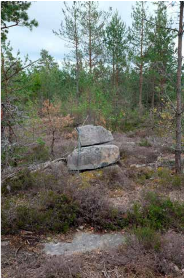
Illustration 11. Vägmärket L2019:2594. Foto mot sydost.