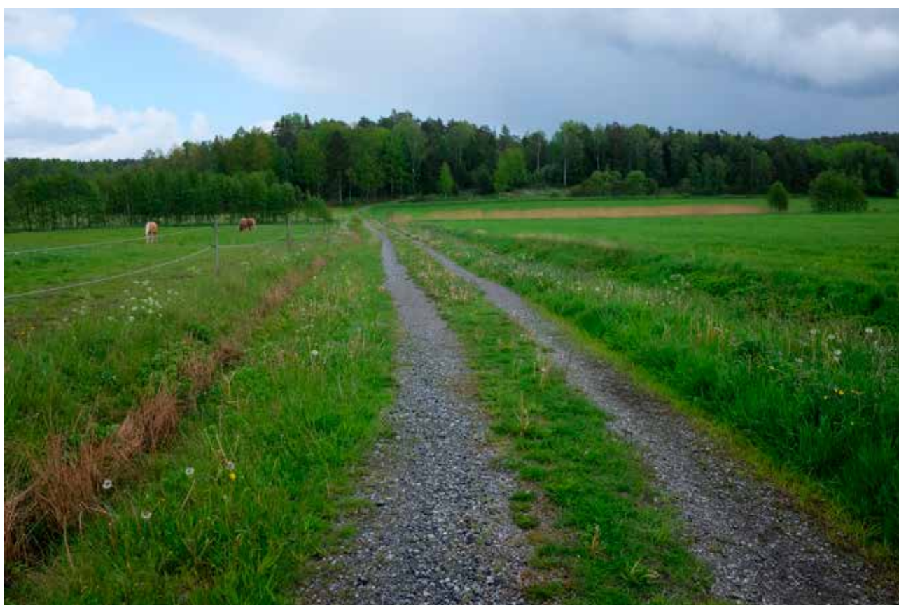
Illustration 2. Bilden är tagen från gården Nedre Lursäng upp mot den planerade vindparken. I skogsbrynet svänger vägen upp i slänten åt höger, i sluttningen nedanför ligger hållristningen L1969:9853. Ovanför i berget på ömse sidor om vägen finns flera stenbrottslämningar. Foto mot norr.

Samtliga lämningar samt förslag på hänsyn framgår av bilaga 1. De lämningar som tidigare berörts men inte gör det längre, framgår av bilaga 2.