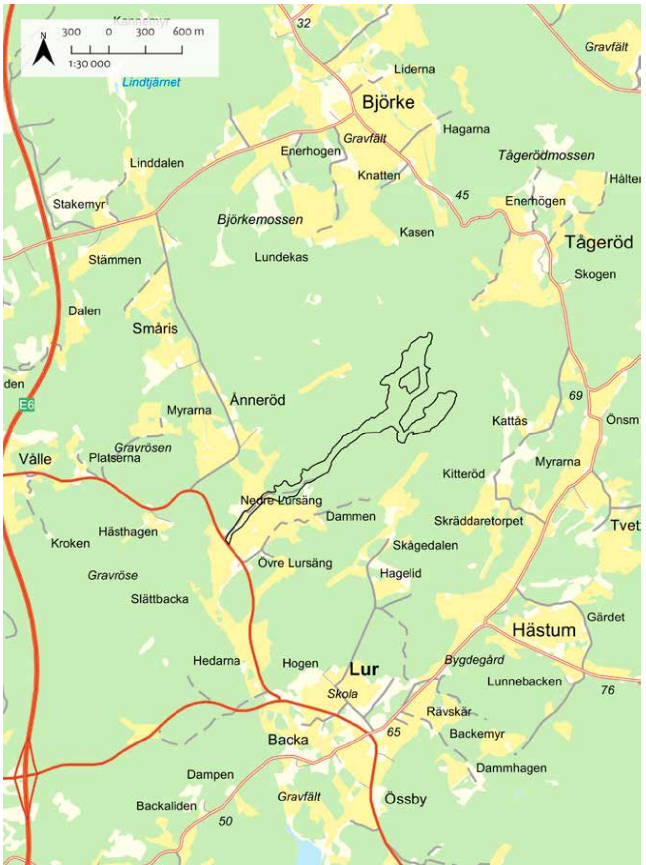
Illustration 1. Utredningsområdets belägenhet norr om Lur.