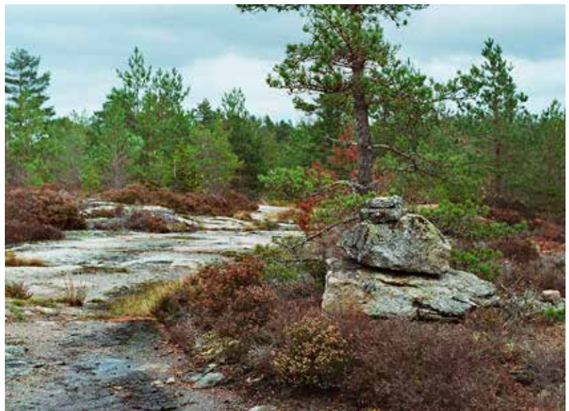
Illustration 8 (överst). Raserat gränsmärke, L2019:2400, vid verksplats 3. Foto mot nordväst. Illustration 9 (underst vänster). Aktivt gränsmärke, beläget i gränsen mellan Skågedalen och Lursäng. Foto mot nordväst. Illustration 10 (underst höger). Vägmärket L1960:6866. Bilden är tagen vid utredning 2008. Foto mot nordost.

ningsområdet, främst i anslutning till vägdragningarna.