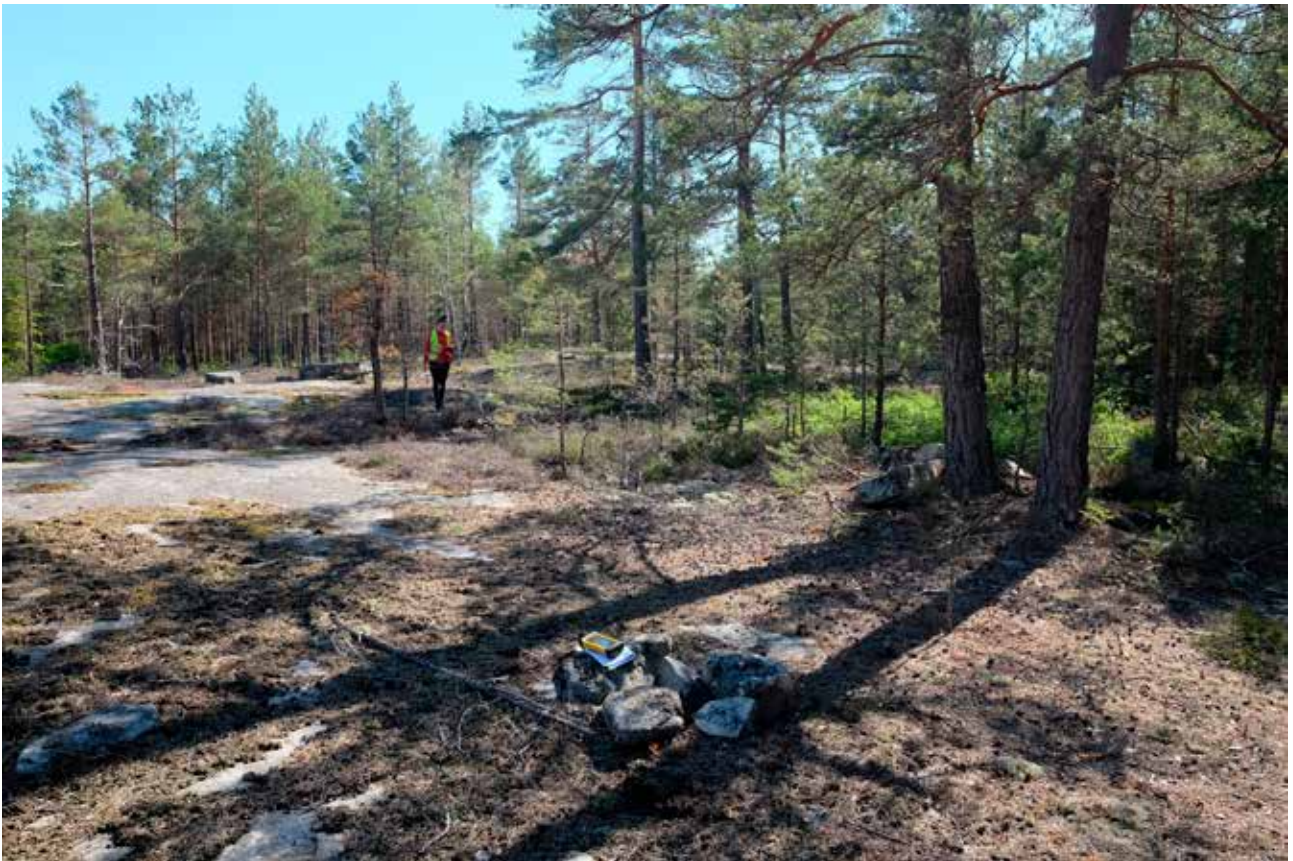
Illustration 4. Ett parti av hållmarken mellan verk 2 och 3. Till vänster bakom Linda syns den så kallade Kycklingstenen, två liggande block med skålgropar inhuggna, L1969:9758 och L1969:9169. Vid foten av de två tallarna till höger i bild ligger de två block som är registrerade som grav markerad med rest sten, L1969:9170. Foto mot söder.